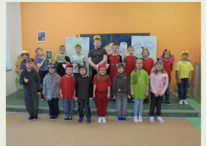
Představení pro školky